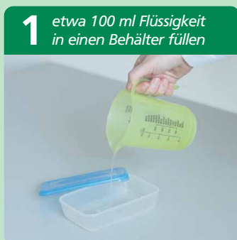
am Beispiel Frischhaltedose

Für ein sauberes und einfaches Ausgießen, halten Sie den Beutel an der oberen Ecke des Beutelbodens fest (siehe Schritt 4).