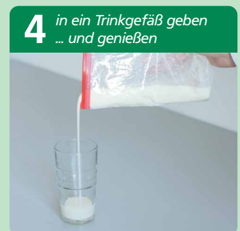
am Beispiel Gefrierbeutel