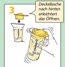
Schütteln, bis sich das Pulver vollständig gelöst hat

Weitere Zubereitungsvarianten: Wenn Sie Ihren Schüttelbecher nicht zur Hand haben oder Sie restoric ® einfach gerne unter Ihre Lieblingspeise mischen möchten, können andere Varianten der Zubereitung Vorteile bringen. Wir haben für Sie verschiedene Methoden ausprobiert: