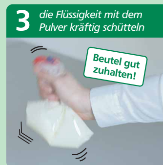
am Beispiel Gefrierbeutel