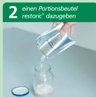
am Beispiel Schraubglas