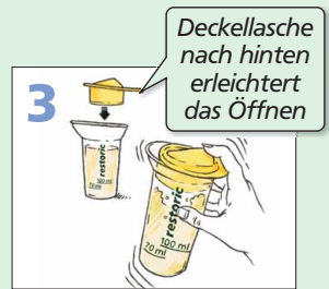
Schütteln, bis sich das Pulver vollständig gelöst hat